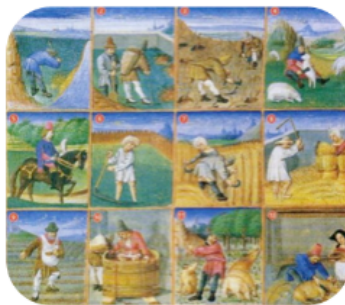
Les travaux agricoles, miniature du XV e siècle