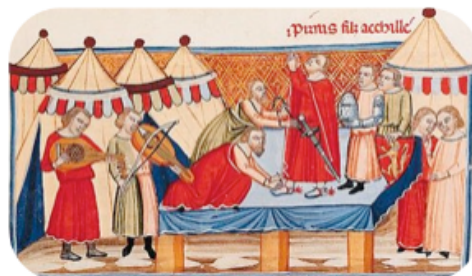
Enluminure représentant l'adoubement d'un chevalier, XIV e siècle