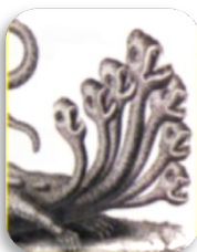
Hydre de Lerne

Accomplit douze travaux réputés impossibles