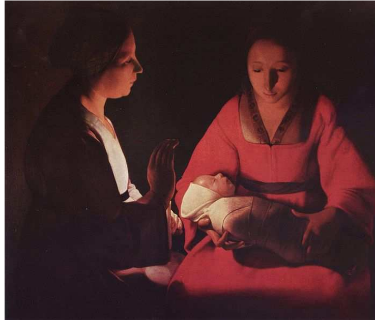
Le Nouveau-né, musée des Beaux-Arts de Rennes