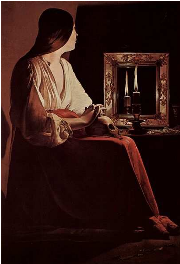
Madeleine en pénitence, Metropolitan Museum of Art , New York