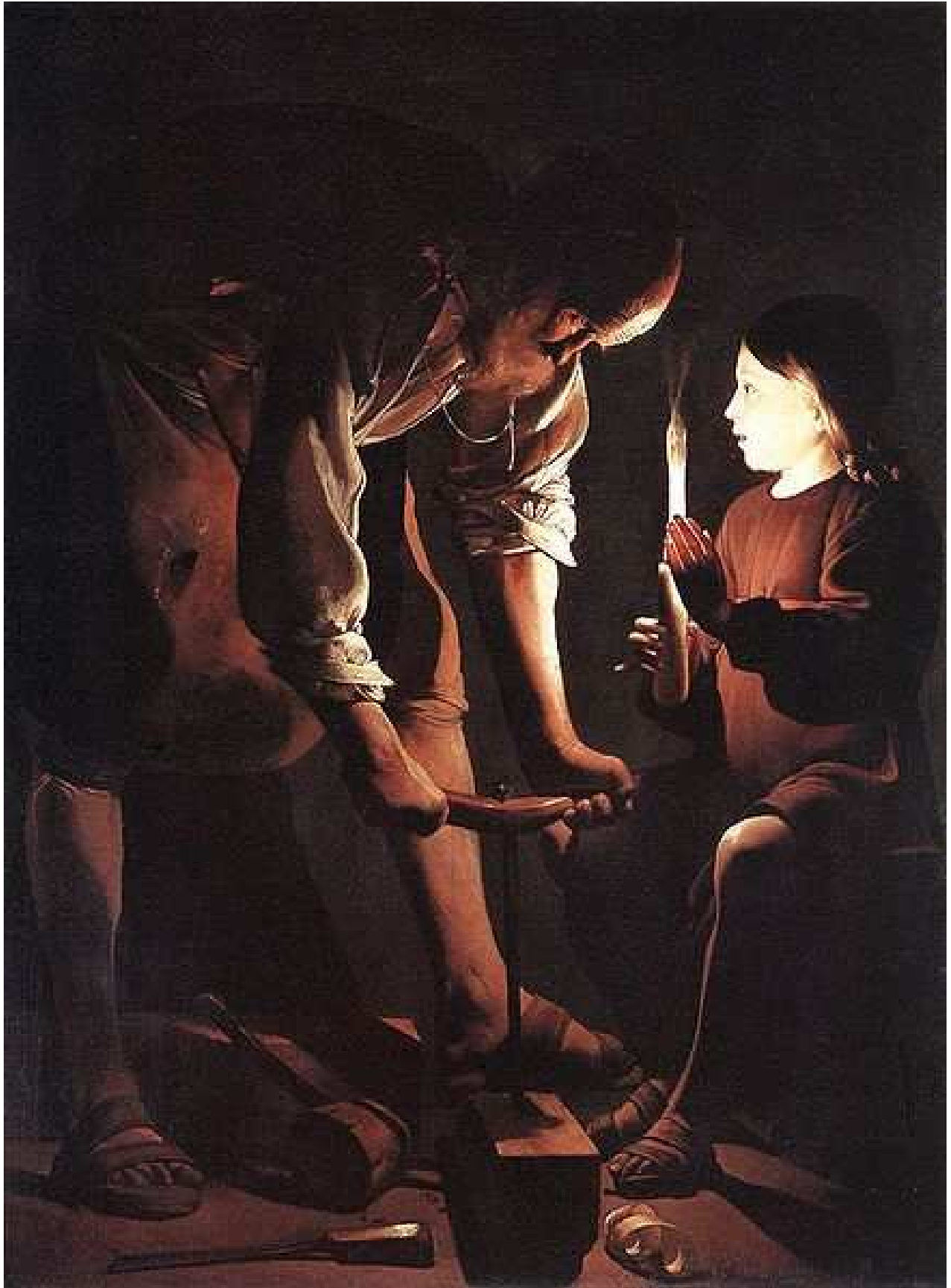
Saint Joseph charpentier , 1643, musée du Louvre , Paris