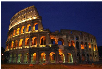
Le colisée de Rome