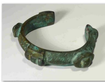
Bracelet romain en bronze (III ème -V ème siècle ap JC)