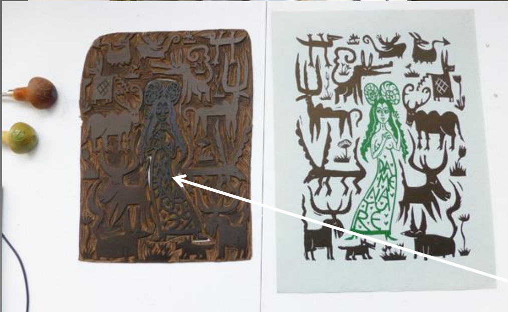
5 - Suites Gravées – 5 artistes