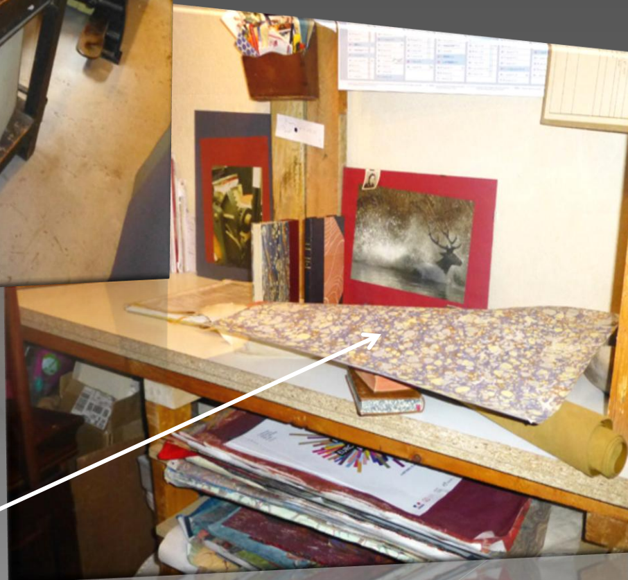
Papier à l'ancienne