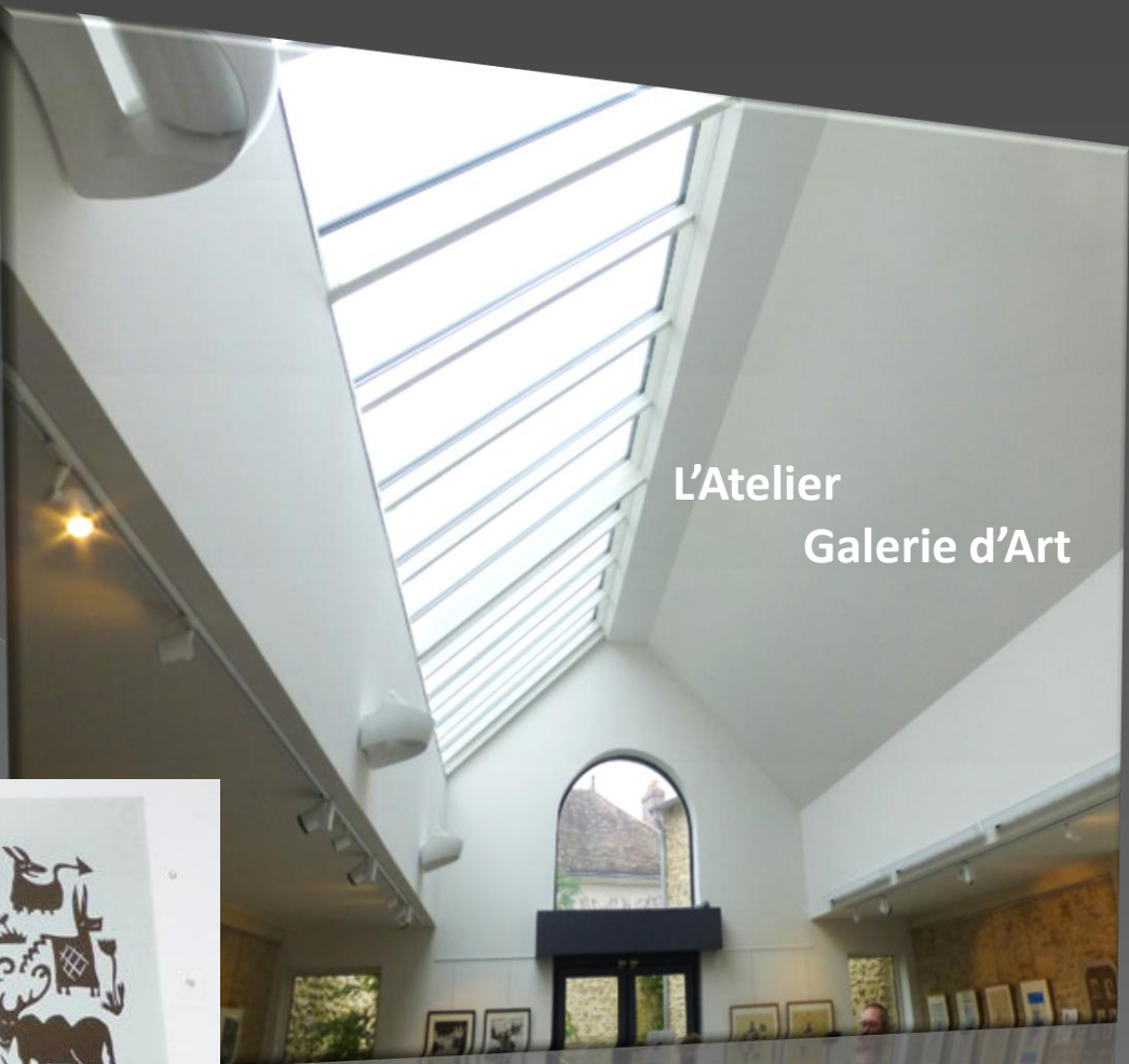
L'Atelier Galerie d'Art