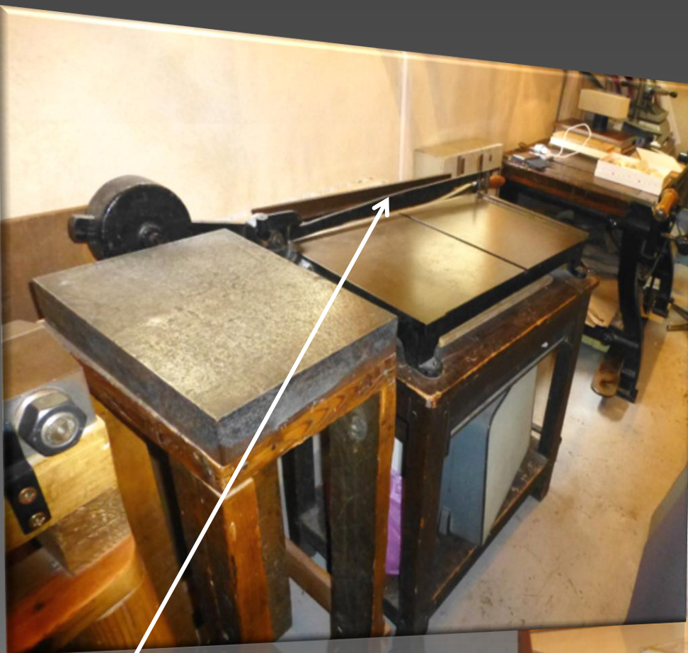
Machine à découper le carton