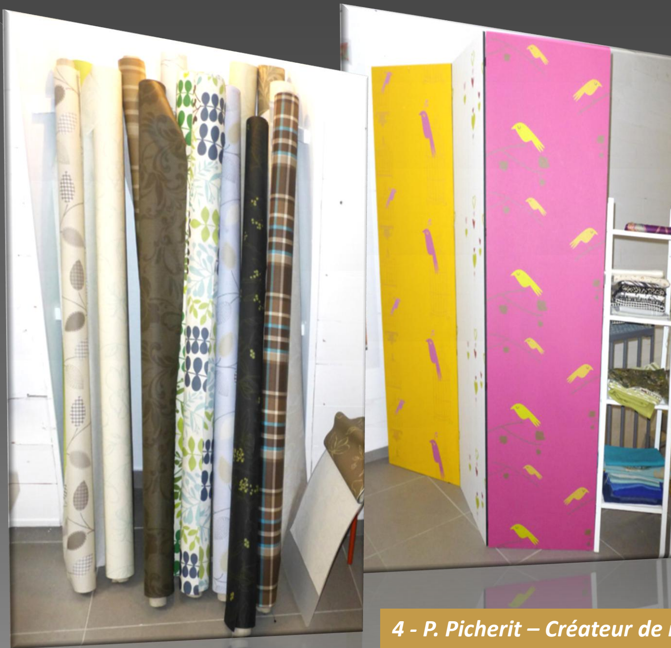
4 - P. Picherit – Créateur de motifs pour textiles et papiers peints