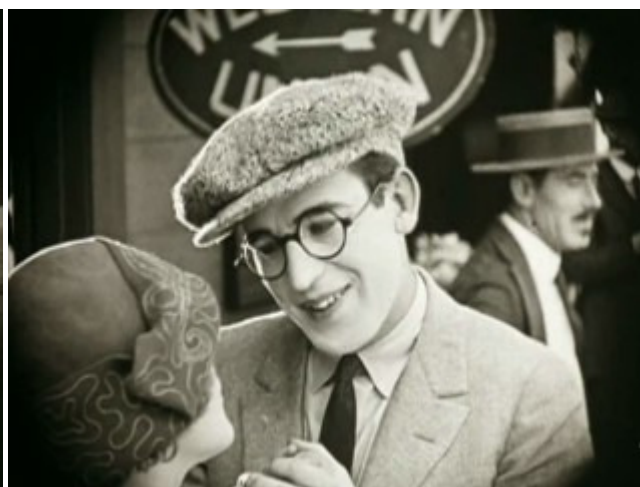
Safety Last! (Fred C. Newmeyer et Sam Taylor / 1923)