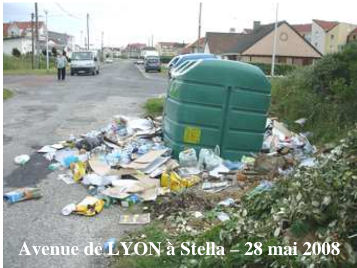
Avenue de LYON à Stella – 28 mai 2008

Les Colonnes d'Apport Volontaire mises en place par la Commune avenue de LYON pour le tri sélectif deviennent systématiquement des dépôts sauvages.