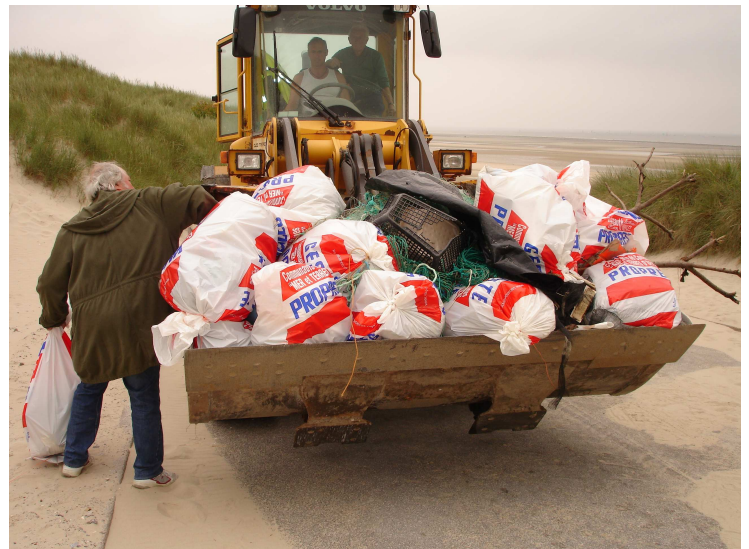
Une récolte édifiante sur l'indiscipline de certains usagers de la plage et de nos espaces dunaires et maritimes

Bouteilles en verre cassées volontairement et laissées à même le sable, cartons, gobelets plastiques, morceaux d'aciers, fils électriques de chantiers, filets de pêche, vêtements, bottes en caoutchouc, plastiques divers, les inévitables crottes de chiens et d'autres objets peu ragoûtants.