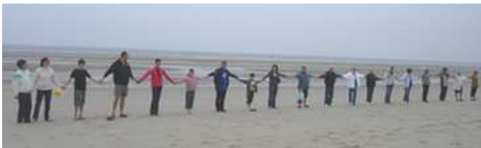
Le Fil Bleu

Le fil bleu a été organisé simultanément dans toutes les stations balnéaires de la Côte d'Opale, le vœu des « Citoyens de l'Océan » étant de faire une chaîne humaine de Dunkerque à Berck avec 100 000 personnes.