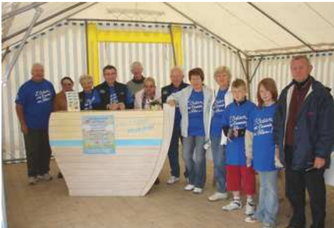
Citoyens de l'Océan

Samedi 7 juin : L'Objectif était de créer un impact de sensibilisation de plus en plus important en formant le fil bleu, véritable chaîne humaine sur la plage tournée vers les terres pour s'opposer de façon symbolique à toutes formes de pollution de la mer par l'homme.