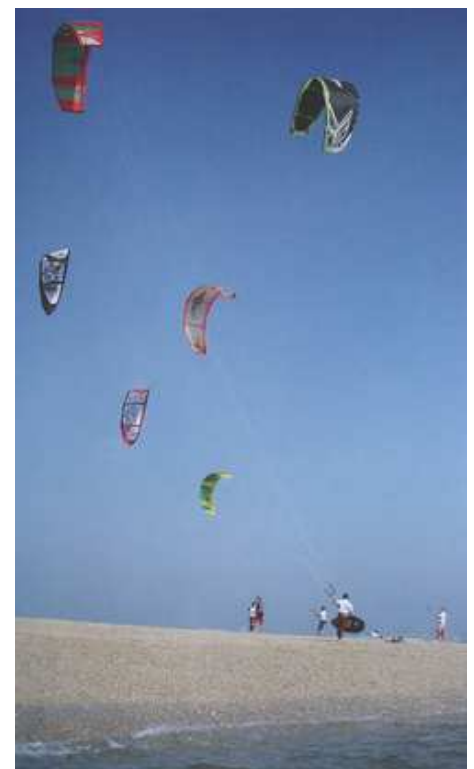
Avec les kite-surfers, l'ambiance fun est toujours au rendez-vous.

Saisissons notre chance de faire de STELLA une station sportive.