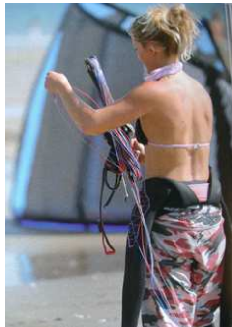
La pratique du kite-surf demande une certaine méticulosité, il ne s'agit pas de s'emmêler les fils.

S'ils le souhaitent, les meilleurs peuvent même se mesurer aux professionnels à l'occasion des « Derby Kite » organisés dans certaines stations balnéaires qui développent ce type de compétition.