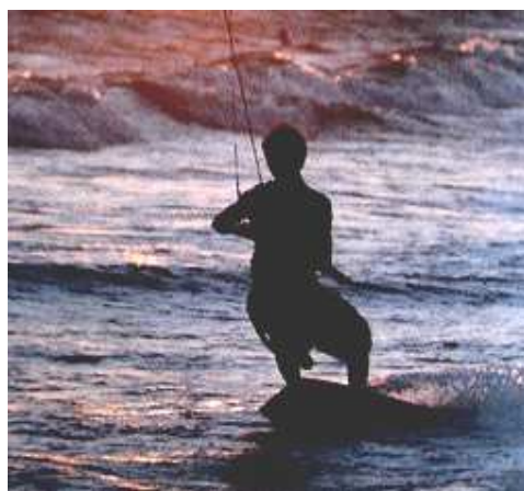
Science des vents et des vagues, un peu d'audace et c'est parti.

Actuellement, les amateurs et passionnés de kite-surf (*) sont de plus en plus nombreux à confronter leurs talents, leur amour du vent et des vagues, leur audace, leur souplesse et leur technique.