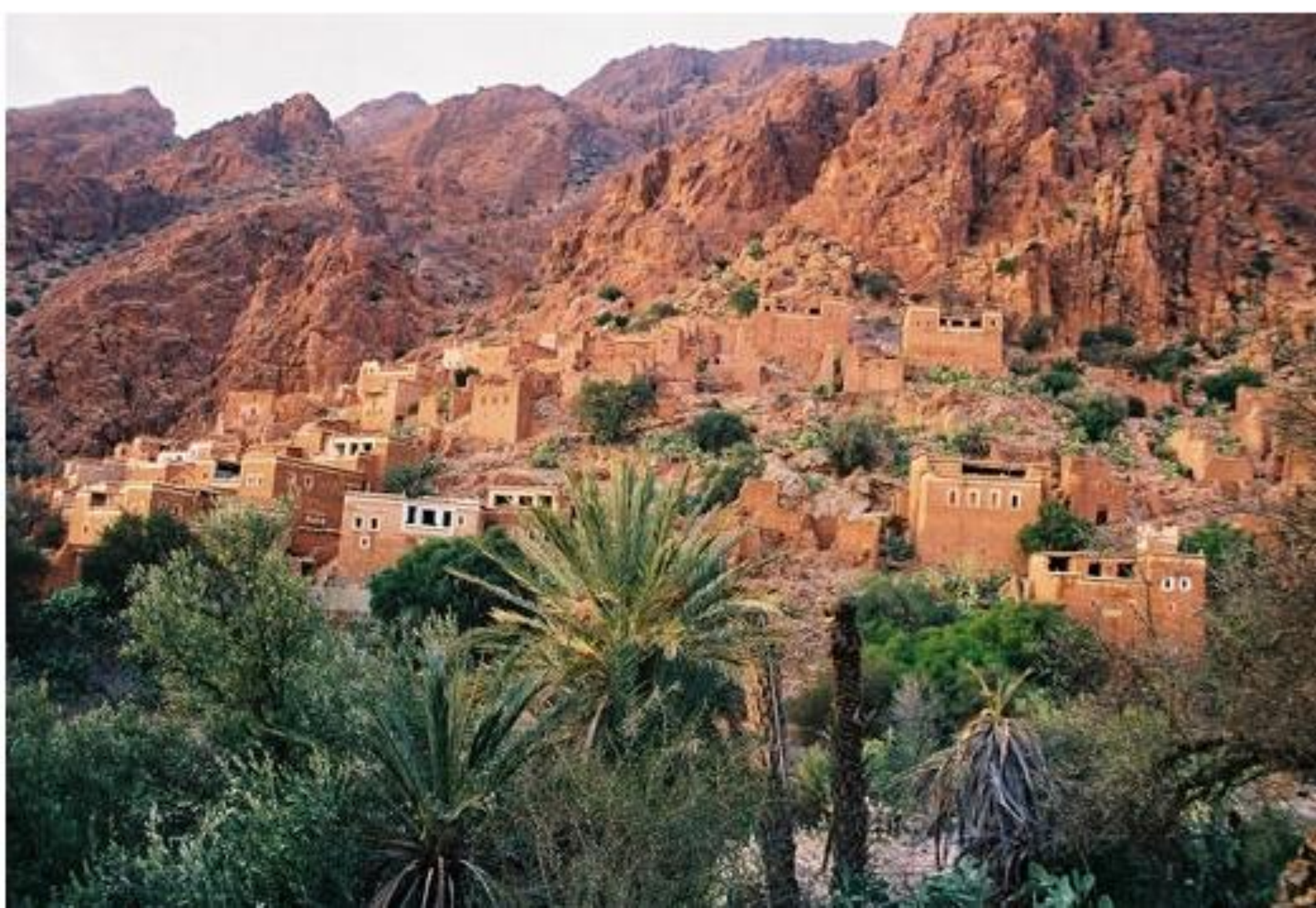
Un village dans l'Atlas