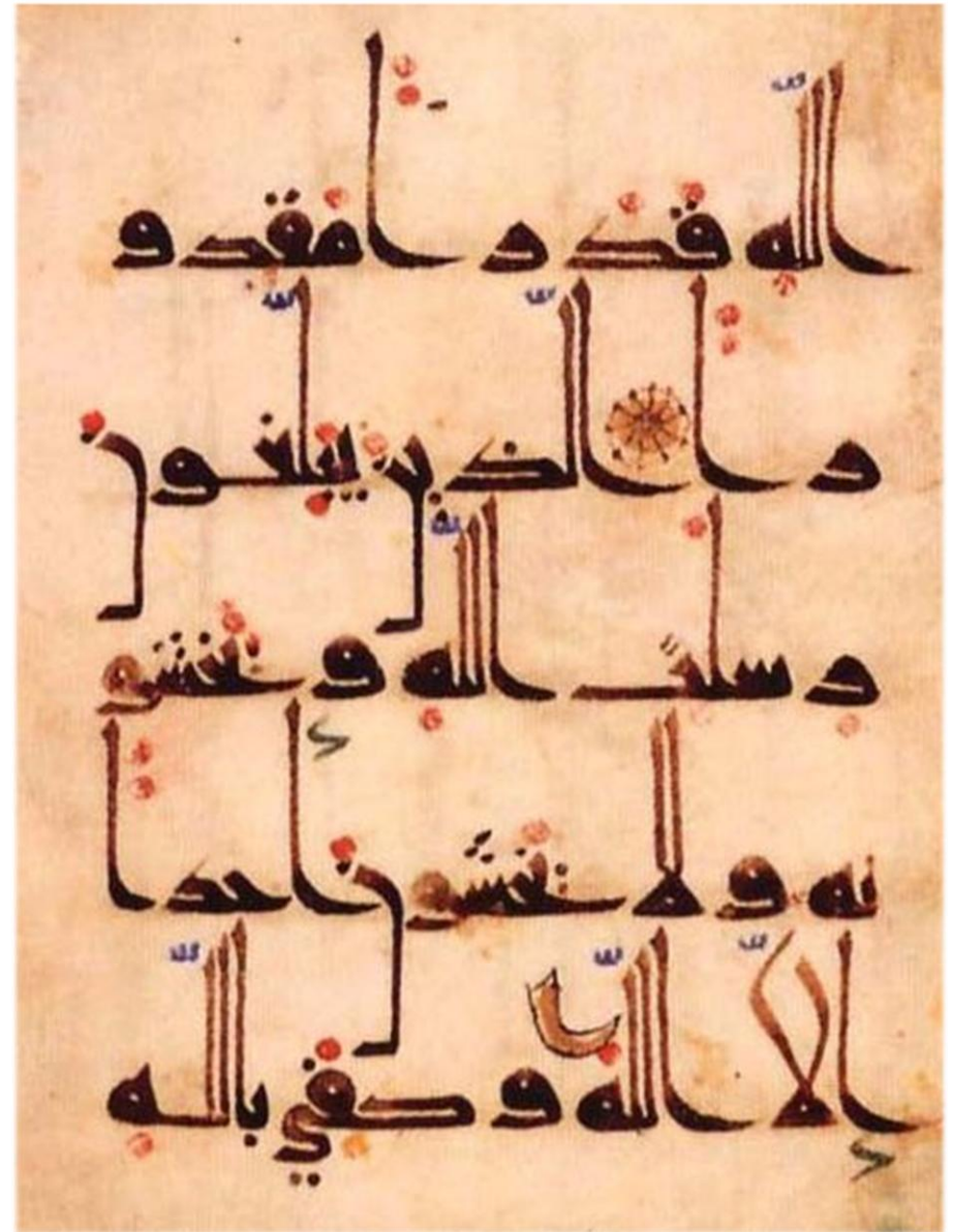
Une page de manuscrit en écriture cursive .