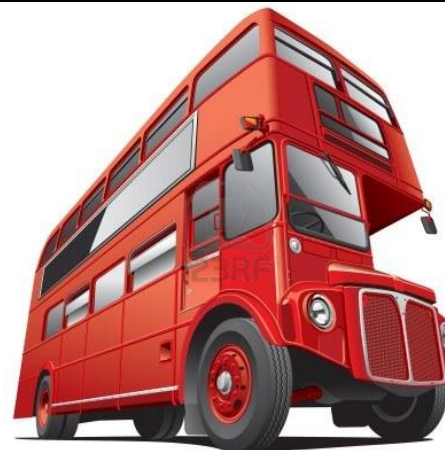
Mascotte de la classe