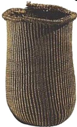
Panier en Osier datant de la période Néolithique.