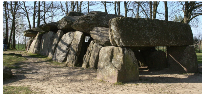
La Roches-aux-Fées, Ille et Vilaine