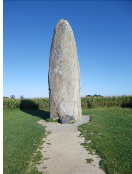
Champ dolent, Ille et Vilaine