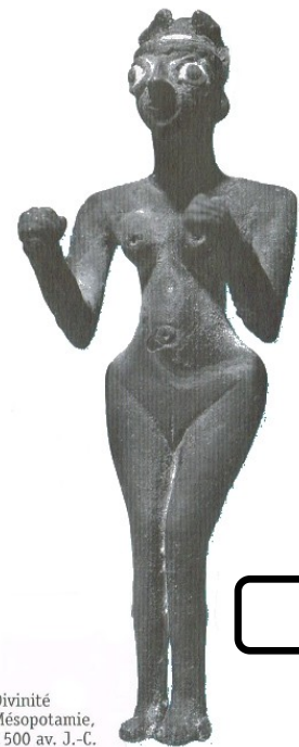
Divinité Mésopotamie, 2 500 av. J.-C.