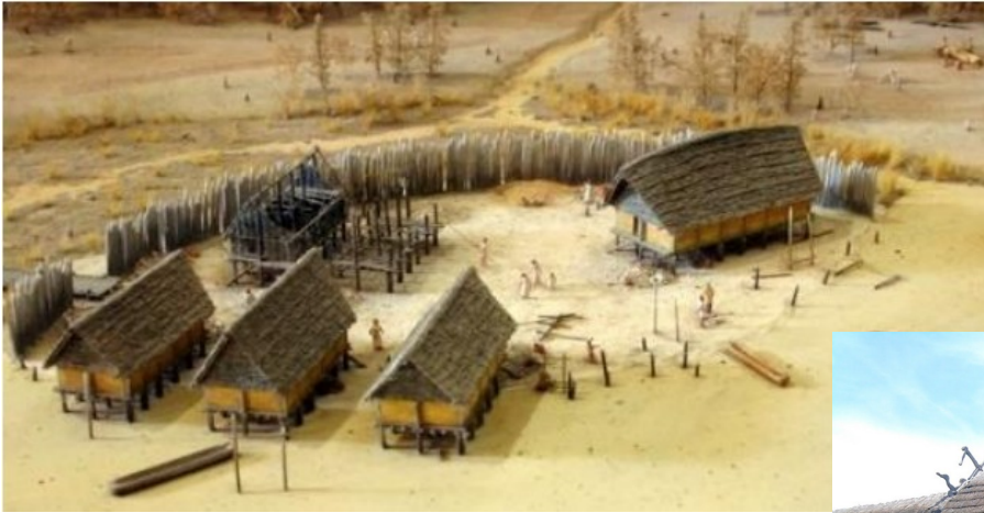
Maquette d'un village du néolithique.

En pratiquant ces activités, qu'est-ce qui va changer dans la façon de vivre des hommes ?