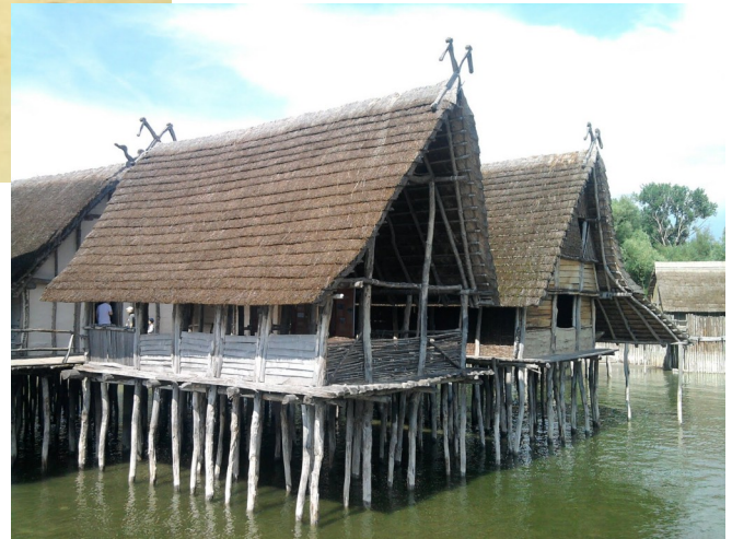
Reconstitution d'une cité lacustre à Unteruhldingen (Allemagne)

Parmi ces habitations, entoure celles des populations sédentaires du Néolithique :