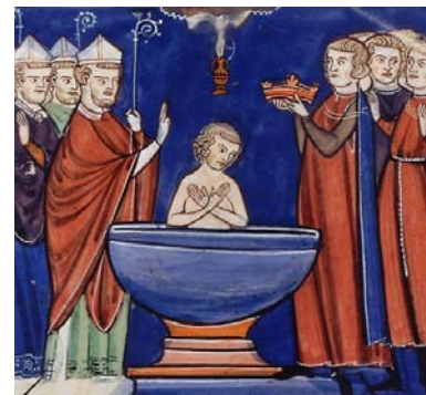
Baptême de Clovis en 496 Enluminure

Clovis et ses successeurs forment la dynastie des Mérovingiens. A la mort d'un roi mérovingien, le royaume est partagé entre tous les fils. Les Mérovingiens ne vont cesser de s'entretuer, laissant le royaume de plus en plus affaibli.