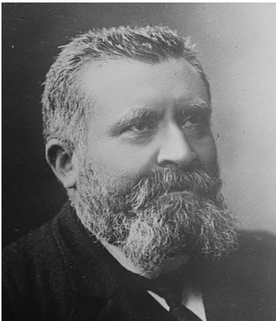
Jean Jaurès, député socialiste, interpellation à la Chambre des députés, le 8 mars 1895.

« Toujours votre société violente et chaotique, même quand elle veut la paix, même quand elle est à l'état d'apparent repos, porte en elle la guerre, comme une nuée dormante porte l'orage. »