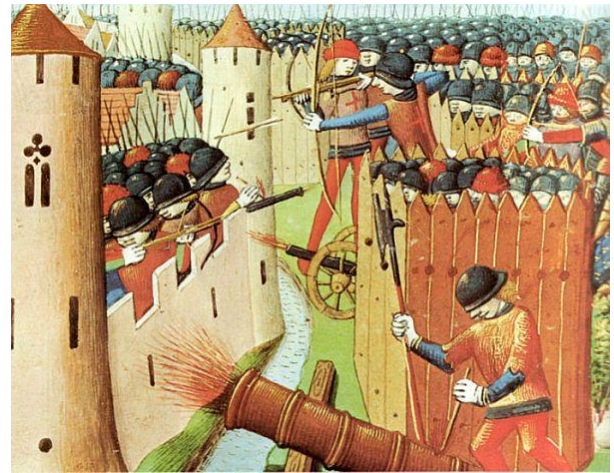
Document B : Jeanne d'Arc lève le siège d'Orléans, 1422