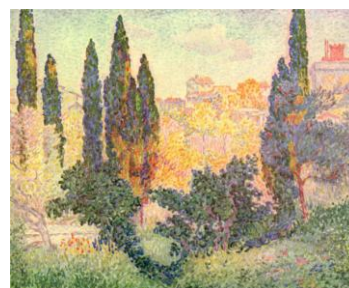
Henri Edmond Cross