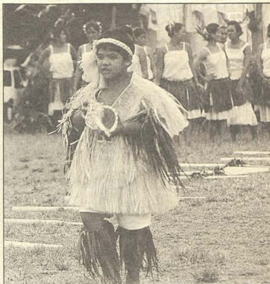
L'enfant se prépare à l'appel (photo R.T).