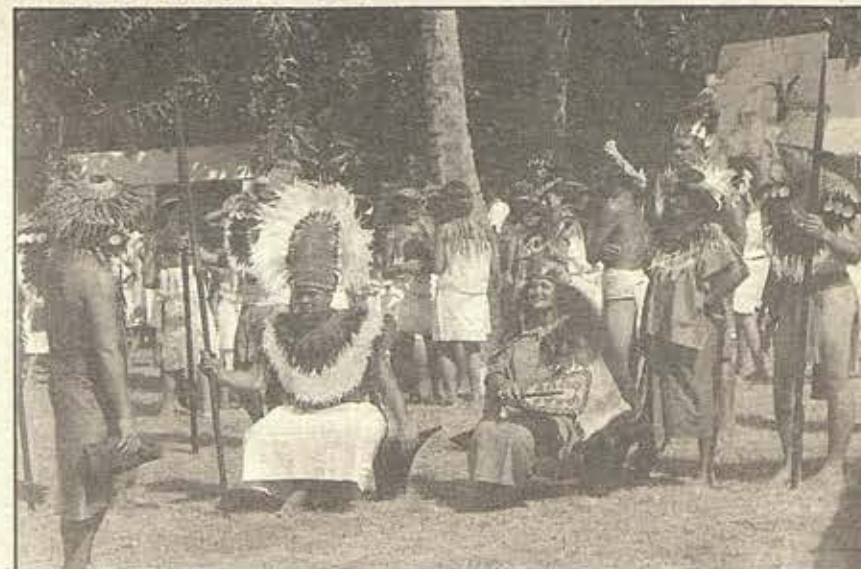
L'accueil du roi Pomare I et de la reine Itia (photo R.Koenig).