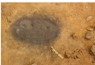
Foyer de Terra Amata

L'usage du feu et la fabrication d'outils amènent les hommes à vivre en groupes et à se réunir autour du foyer .