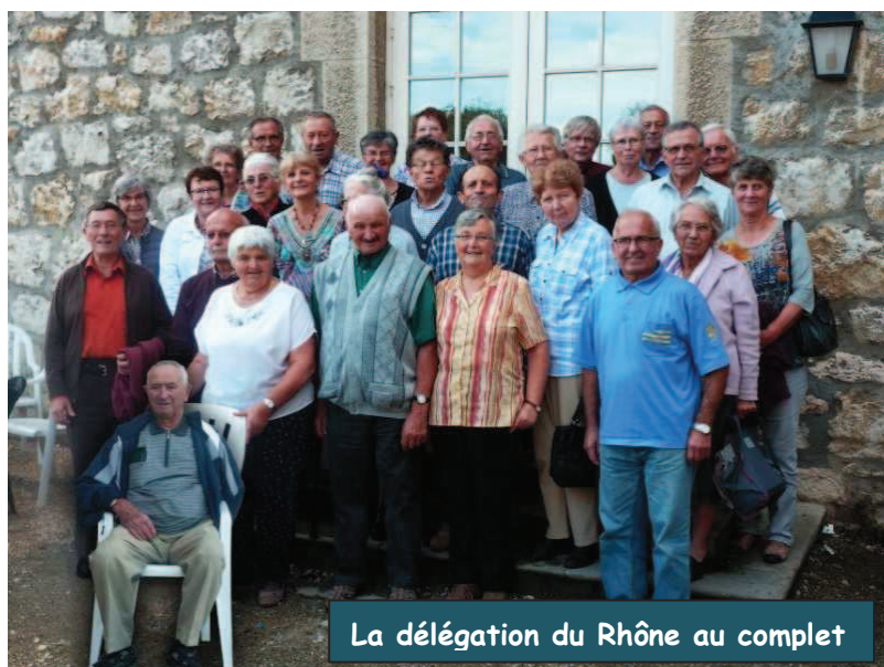
La délégation du Rhône au complet

Nous étions 96 participants, dont 29 du Rhône, une moyenne d'âge de 72,48 à la session du C.M.R. Aînés à Belley (01). Après ces deux journées, nous ne vous faisons pas un compte rendu, nous vous disons simplement notre ressenti. Nous avons beaucoup entendu les mots : amour, partage, compassion, écoute, relations.