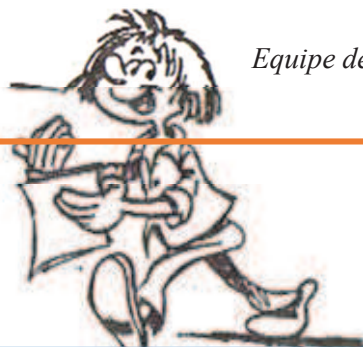
Equipe de Savigny

Journées apaisantes et régénératrices.... à renouveler !