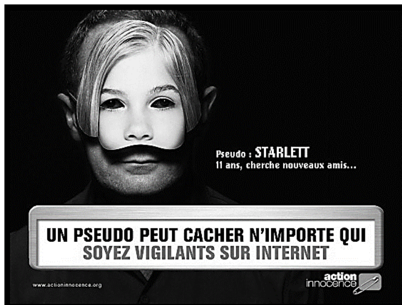
Campagne de sensibilisation aux dangers du Net.

Que peux-tu dire de l'affiche d'action innocence ci-dessus ?