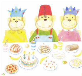
Zum Geburtstag gehen