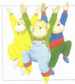
mit meinen Freunden sein