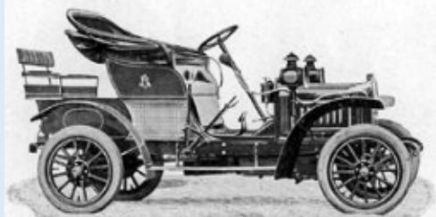
Doc 1 : Une des premières automobiles

Les transports évoluent également. Les bateaux à vapeur remplacent la marine à voile et le réseau ferré continue de se développer.