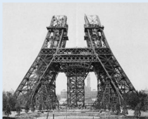
Doc 2 : Construction de la Tour Eiffel 1887-1889