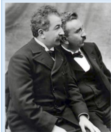
Doc 4 : Louis et Auguste Lumière