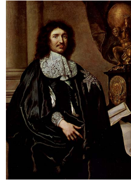
↑ Colbert intendant des finances de 1661 à 1683