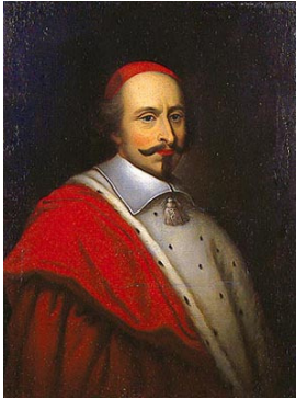
↑ Le cardinal Mazarin, ministre de Louis XIV de 1642 à 1661.