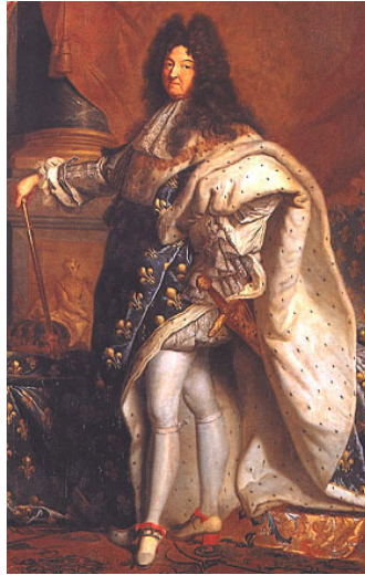
↑ Louis XIV, le Roi-Soleil