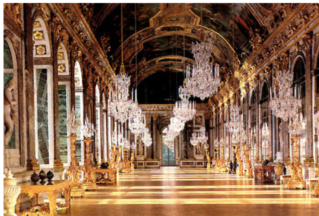
↑ Le château de Versailles : la galerie des glaces.