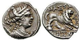
Monnaie d'argent de Massalia. Première moitié du IIe siècle avJC