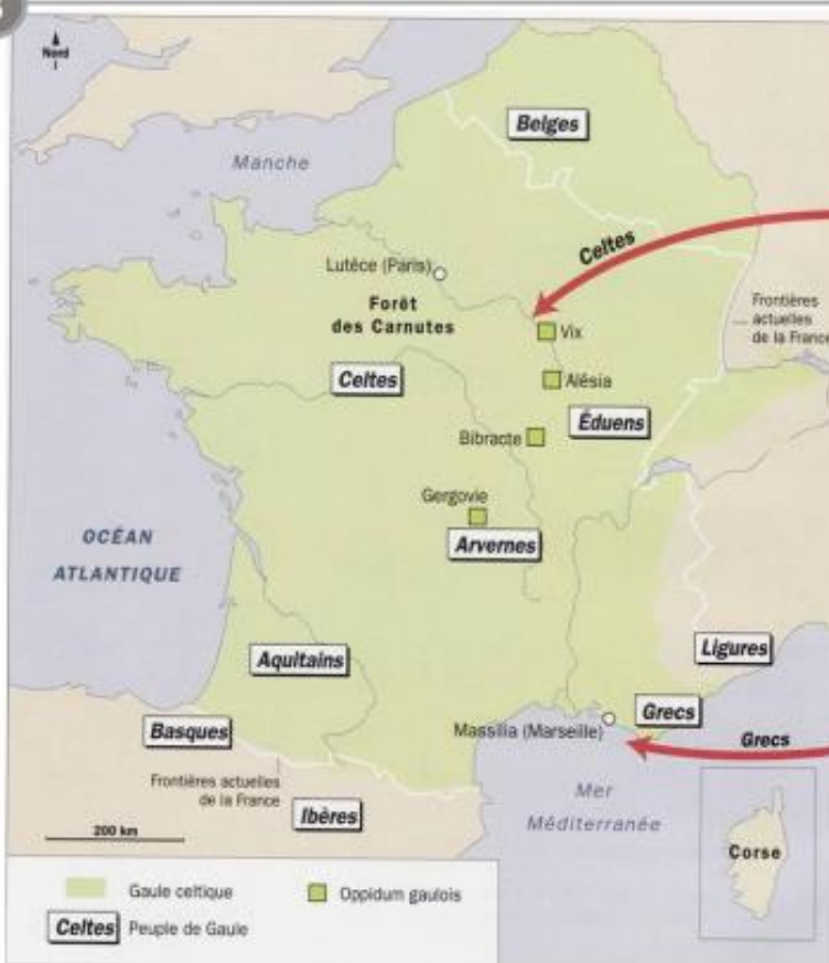
La Gaule celtique, VII ème -I er siècle av. J.-C.