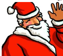
le Père Noël