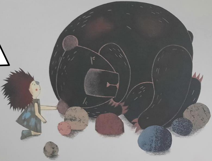
Le garçon tira délicatement une oreille de l'ours... qui ne bougea pas.