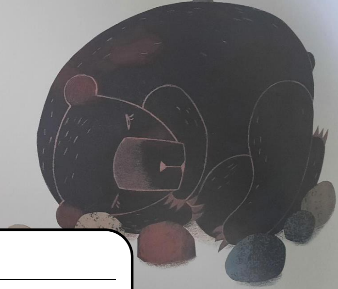
Il sauta alors sur l'animal endormi... sans résultat. L'enfant sauta en criant... en vain.