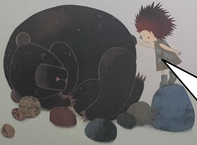
Il pinça sa petite queue ronde... le plantigrade ne réagit pas.