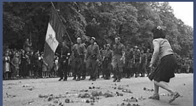
Défilé de la libération à Dijon