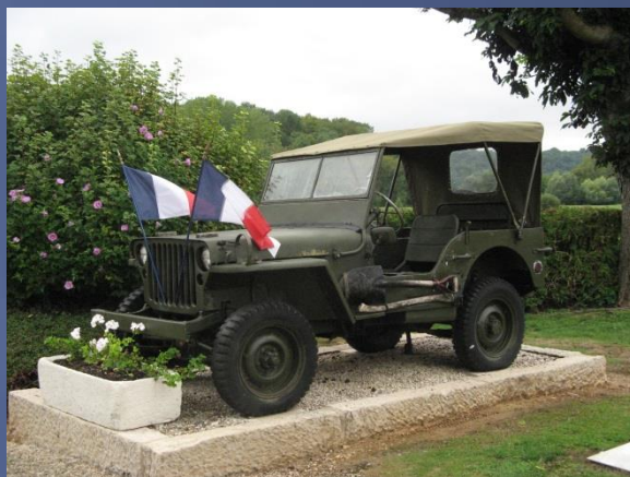
Jeep 1 ère D.F.L. Half-track « Tchad » 2 e D.B.