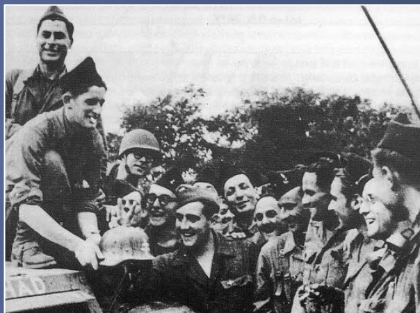
Cliché de la jonction - Archives 1 er R.F.M. - A.D.F.L.

Credit : Jean Pflieger – Consulter la carte sur Google map Lien