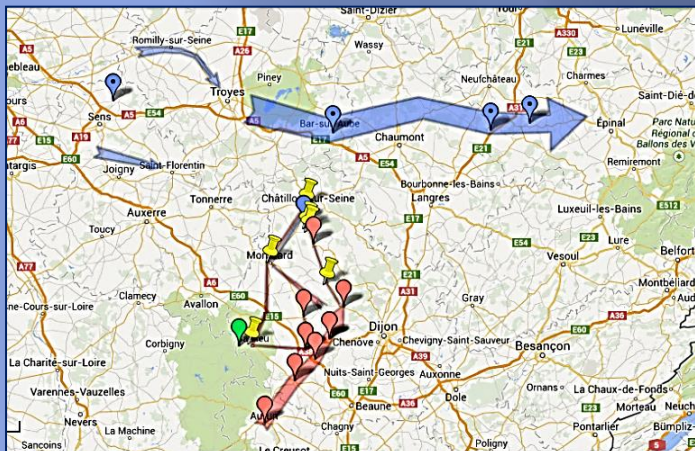
12-14 septembre 1944 - Carte des itinéraires suivis par la 2 ème D.B. (bleu) et la 1 ère D.F.L. (rouge) et points de « jonction » entre les 2 Divisions (jaune) dans la région de Châtillon-sur-Seine

Credit : Jean Pflieger – Consulter la carte sur Google map Lien