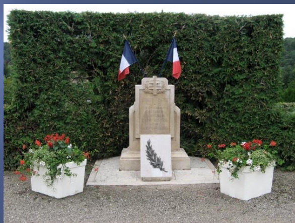
1 ère stèle en mémoire de l'évènement, sur les lieux mêmes de la jonction et non loin de la nouvelle stèle (ci-dessous) - Crédit photos : Jean Pflieger