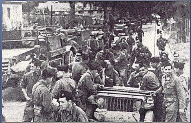
Jonction en Bourgogne - C.P. : Libertyship.be

Revue de la France Libre n° 79 - 18 Juin 1955 - Numéro spécial