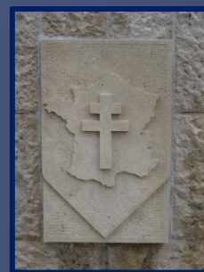
Insignes divisionnaires de la D.F.L. et de la D.B.