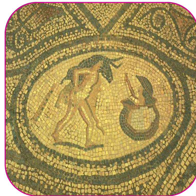
Mosaïque romaine représentant Héraclès remettant le sanglier à Eurysthée

4) Quelle est la tâche suivante imposée à Héraclès par Eurysthée ? _____