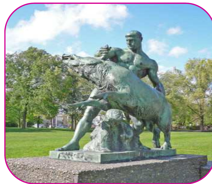
Héraclès et le sanglier d'Erymanthe