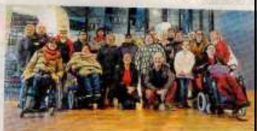
Beaucouzé, bowling. Les participants d'Handi'namique heureux de se rencontrer pour un moment festif.

L'association Handi'namique a organisé dernièrement une rencontre handicapés et valides au bowling de Beaucouzé.