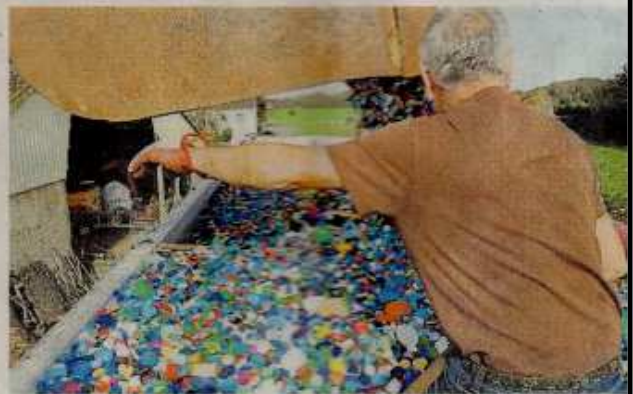
L'association Handi'namique collecte près de dix tonnes de bouchons chaque année.