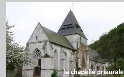
la chapelle prieurale

Les raisons de la séparation du sanctuaire monastique de l'église paroissiale restent obscures. On suppose que la paroisse de St Philbert est passée dans la dépendance de l'abbaye de Saint Ouen de Rouen. Ceci est peut être la cause de la rupture avec le prieuré qui dépendait d'une autre abbaye.