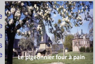
Le pigeonnier four à pain

A l'origine, l'église et le prieuré formaient un unique édifice. Par la suite, la chapelle prieurale fut édifiée sur les bases du chœur de l'église primitive