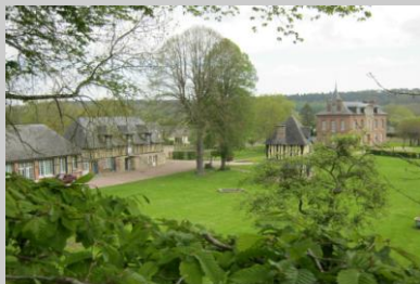
Vue sur l'enceinte du Prieuré

Ces libéralités sont sans doute dues au fait que Guillaume de Montfort, 3 ème Abbé du Bec (1093/1124) était alors lié de parenté à Robert et Hugues de Montfort.