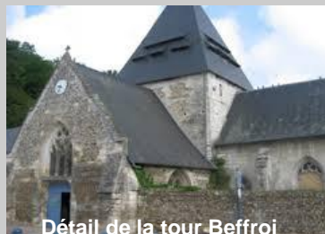
Détail de la tour Beffroi