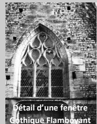
Détail d'une fenêtre Gothique Flamboyant