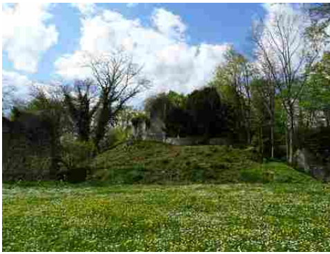
La motte castrale et le donjon