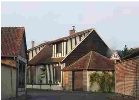
Quelques rues d'Avrilly

Les avis seront cohérents avec ceux émis ces derniers années, à savoir : pas de maisons à volume compliqué (type V, W, Y, ou Z), pentes à 45° pour les volumes principaux, ardoise ou tuile plate de teinte brun vieilli, à 20u/m 2 , avec un débord de toiture de 20cm, enduit de teinte beige clair avec modénatures (au choix : chaînages, encadrement de fenêtres, soubassement, colombage...). *Voir les autres fiches.