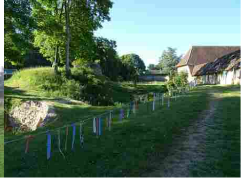
Les fossés et le corps de ferme voisin

Pour la zone en rose foncé dans le périmètre de 500m