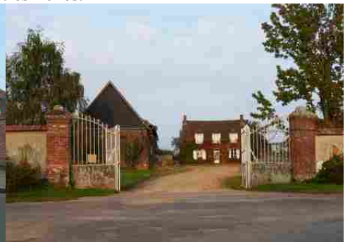
L'entrée d'un corps de ferme