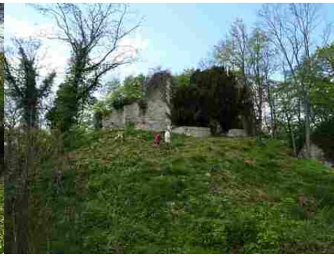
Des vues proches du donjon