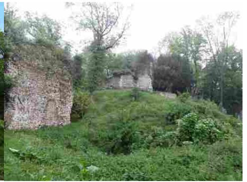
Les fossés entourant la motte