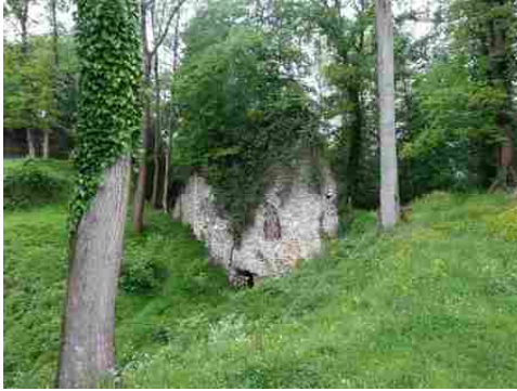
Des vestiges de fortification