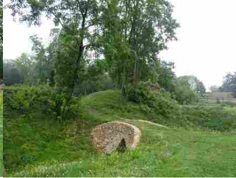
Les anciens fossés de la basse-cour