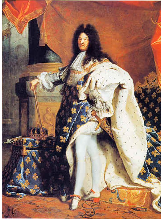
par Hyacinthe Rigaud (1701)