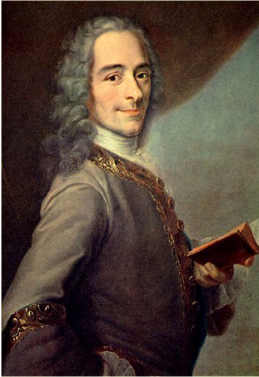
Voltaire, écrivain et philosophe du XVIIIe siècle. Il critique principalement la religion et dénonce la traite des Noirs (dans son livre Candide ).