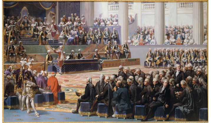
Séance d'ouverture des États généraux à Versailles. Tous les ordres sont présents, ils ont été convoqués par le roi pour parler de la crise que connaît la France.

5 mai Séance d'ouverture des États généraux 14 juillet Prise de la Bastille par le peuple armée 4 août Pressée par les insurrections paysannes, l'assemblée abolit le régime féodal sous la poussée d'une poignée de nobles libéraux. 26 août Déclaration des Droits de l'Homme et du Citoyen.