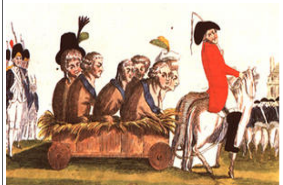
Caricature de la famille royale après leur fuite à Varennes.

Cette condition ne plaît pas au roi qui décide de s'enfuir pour demander de l'aide aux rois étrangers afin de remettre en place le système féodal. Sa fuite s'interrompt à Varennes le 20 juin 1791. Il est ramené à Paris. En 1792, avec l'arrivée de la nouvelle assemblée : la Convention, la République est proclamée (22 septembre 1792). La France peut se passer de son roi. Louis XVI sera guillotiné le 21 janvier 1793.