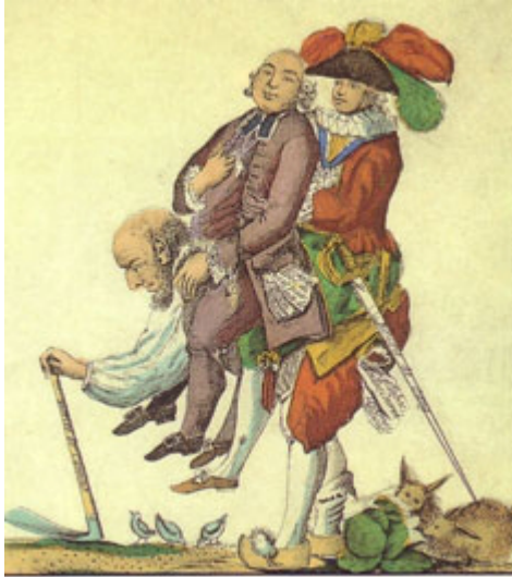
Caricature des 3 ordres Le peuple écrasé par les privilégiés