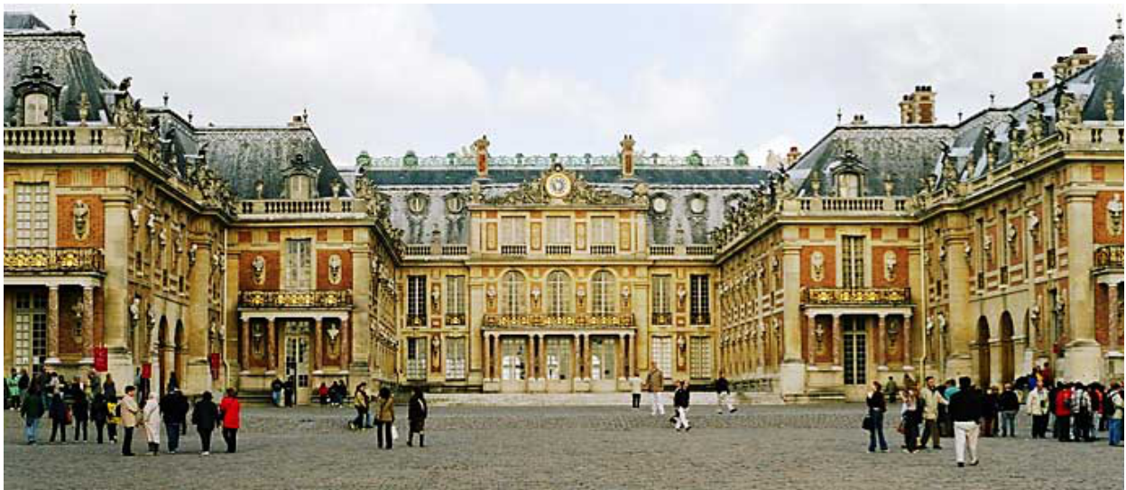
Le château de Versailles, résidence de Louis XIV Il occupait la chambre la plus proche de la salle dans laquelle il se réunissait avec ses conseillers au centre du château.