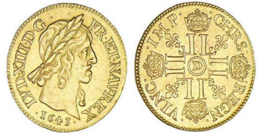
Écu d'argent de Louis XIII Le Juste (système monétaire utilisé jusqu'à la Révolution française)

A sa mort en 1642, il sera remplacé par le Cardinal de Mazarin qui gardera ensuite son poste auprès du fils de Louis Le Juste : Louis XIV.