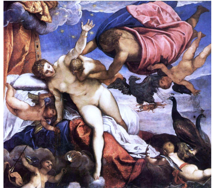
Origine de la Voie lactée par Le Tintoret (vers 1550)