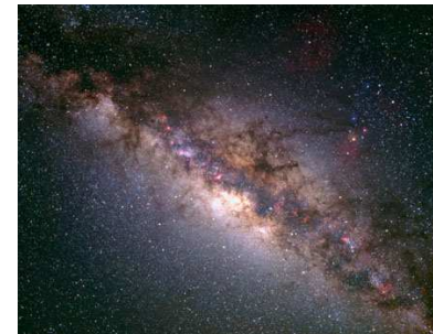
La Voie lactée

La Voie lactée : nom donné à la galaxie dans laquelle se trouve notre système solaire.