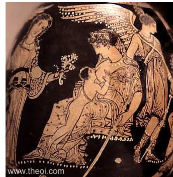
Héra allaitant Héraclès, British Museum