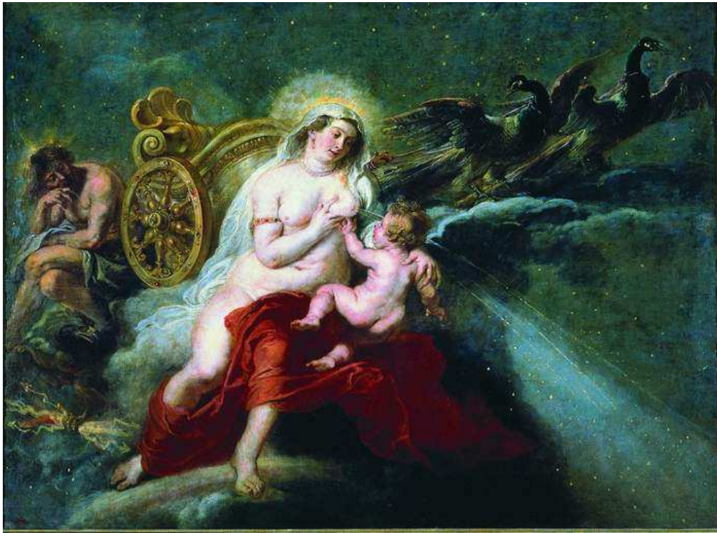
Représentation d'Héra allaitant Héraclès par Rubens