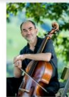
CHRISTOPHE COIN RÉCITAL DE VIOLONCELLE SEUL BACH, GABRIELLI, DALL'ABACO

Participation au chapeau, une partie sera versée à l'association du patrimoine