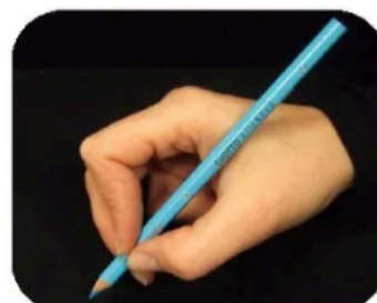
Le haut du crayon est posé dans le creux entre le pouce et l'index.