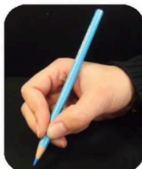
Le crayon est posé sur la première phalange du majeur.