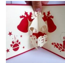
carte de vœux