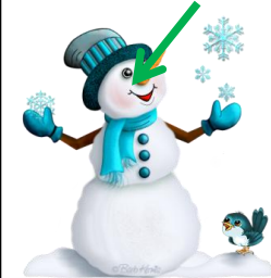
bonhomme de neige