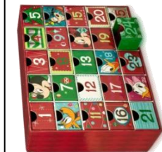
calendrier de l'avent