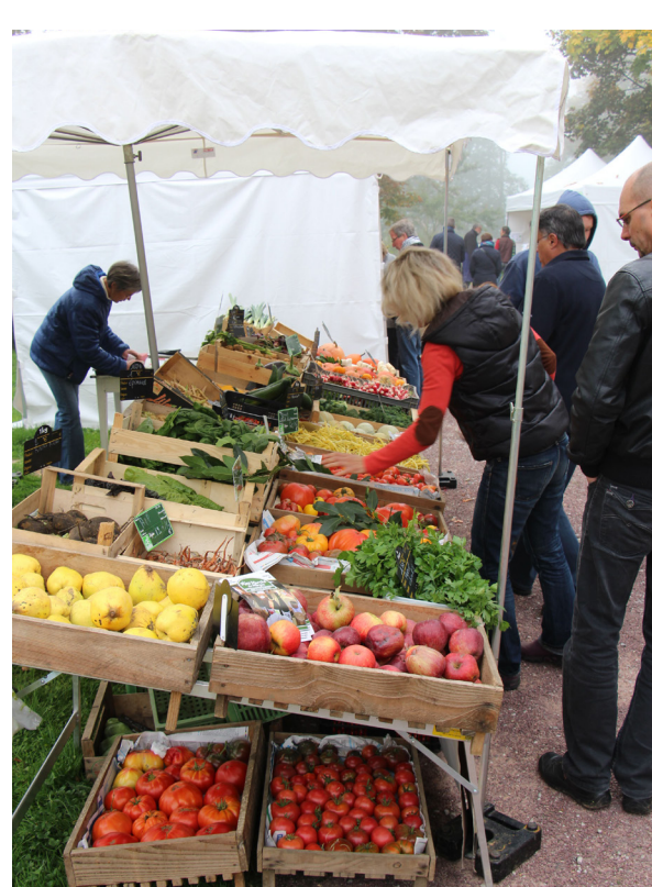
La manifestation Saveurs d'automne a eu lieu le mois dernier à la Maison du Parc pour sensibiliser le public aux vertus d'une consommation locale.

Les circuits courts alimentaires de proximité constituent aujourd'hui une opportunité économique non négligeable que ce soit pour le producteur (sécurisation de son modèle économique), le consommateur (prix ajusté au coût réel) ou le territoire (création d'emplois locaux).