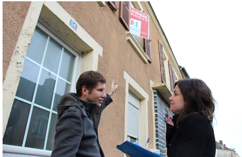
900 logements vacants ont été recensés dans 20 bourgs-pôles du Parc.

Le Parc s'est emparé d'un sujet qui touche à la fois l'urbanisme durable, l'économie de terres agricoles, la rénovation thermique et invite plus largement à repenser la vie dans nos communes : la résorption des logements vacants en centre-bourg. C'est cette initiative percheronne qui sera présentée dans le cadre de la COP21, parmi les 51 propositions émanant des Parcs naturels régionaux.