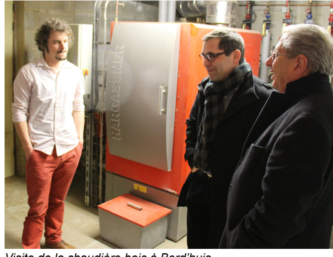
Visite de la chaudière bois à Berd'huis.