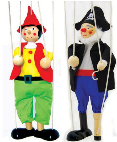
des pantins - des pantins