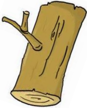
une bûche - une bûche