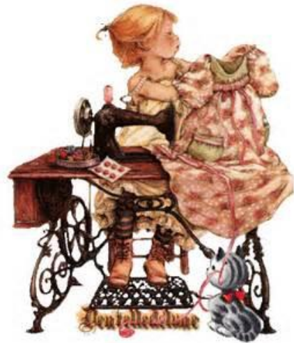
Elle confectionne des habits.

A lire - à lire : au - eau - tau - veau - seau - ceau eau - lo - loi - li - il - mau - noi - pou - rua - doi - toi - cou une fois - du bois - en - il - que - et - des - les je - me - se - lui - son - pour - mes - de - dans - au - sa Il était une fois ... Un roi ! Non, un morceau de bois.