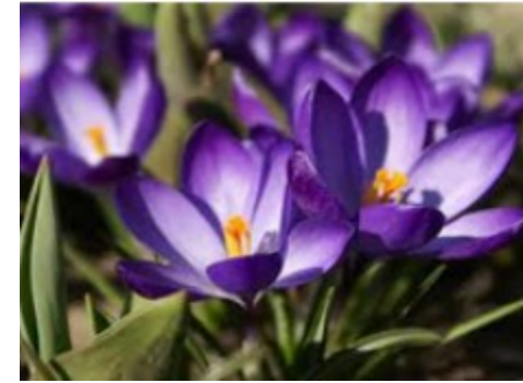
DES CROCUS des crocus des crocus