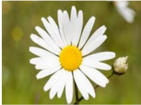
UNE MARGUERITE une marguerite une marguerite