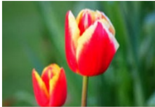
UNE TULIPE une tulipe une tulipe