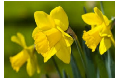
UNE JONQUILLE une jonquille une jonquille