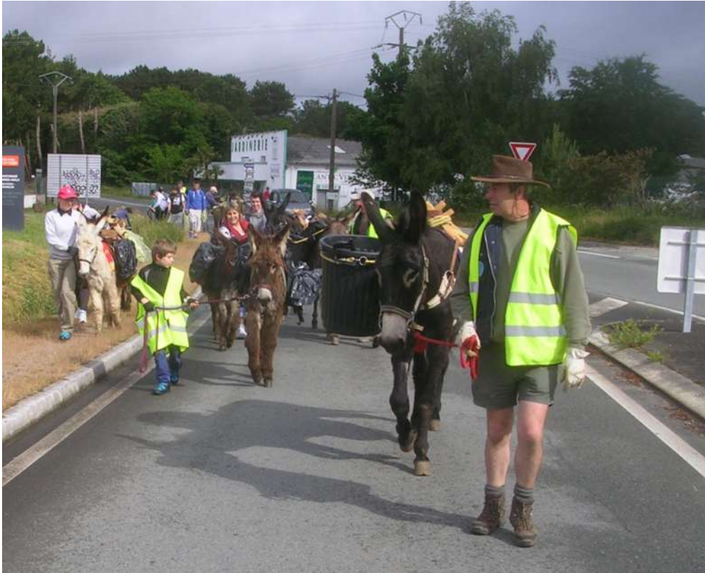
Départ pour le nettoyage des bords de routes