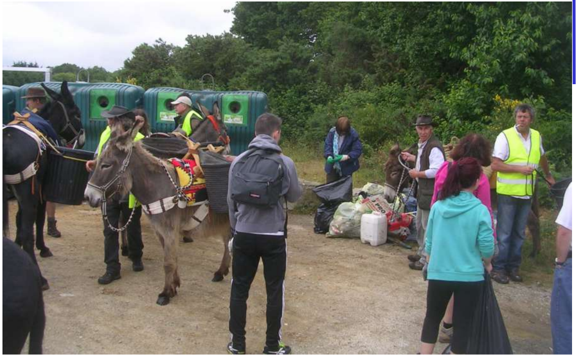
Dépôt au « point verre » après la déchetterie de Ploeren