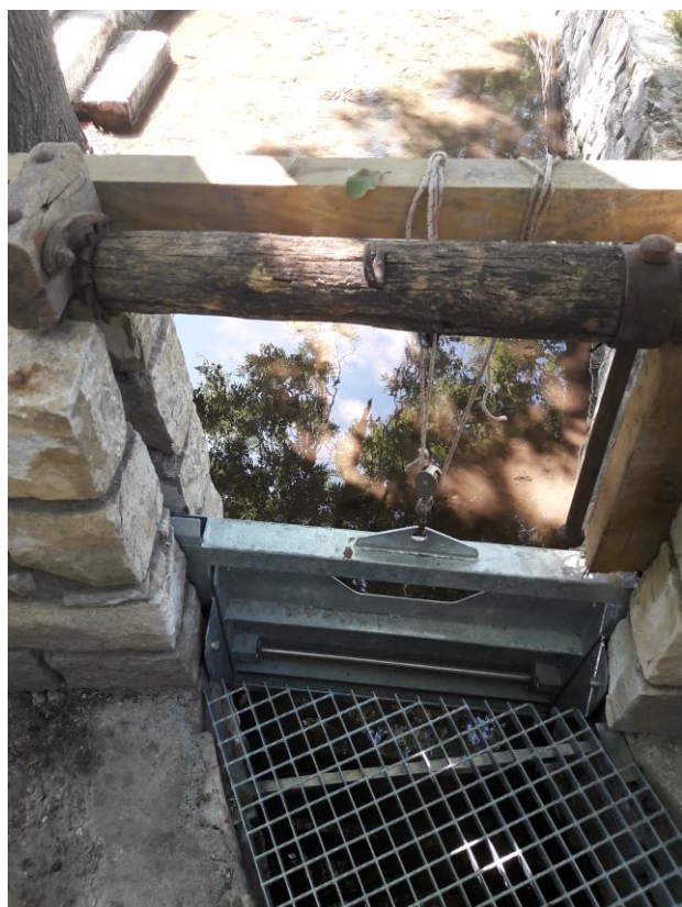
Vue aval de la vanne PANAVAN (système de poulie en cours de réflexion)

Objectif : « Marier » au mieux le caractère authentique et le modernisme.