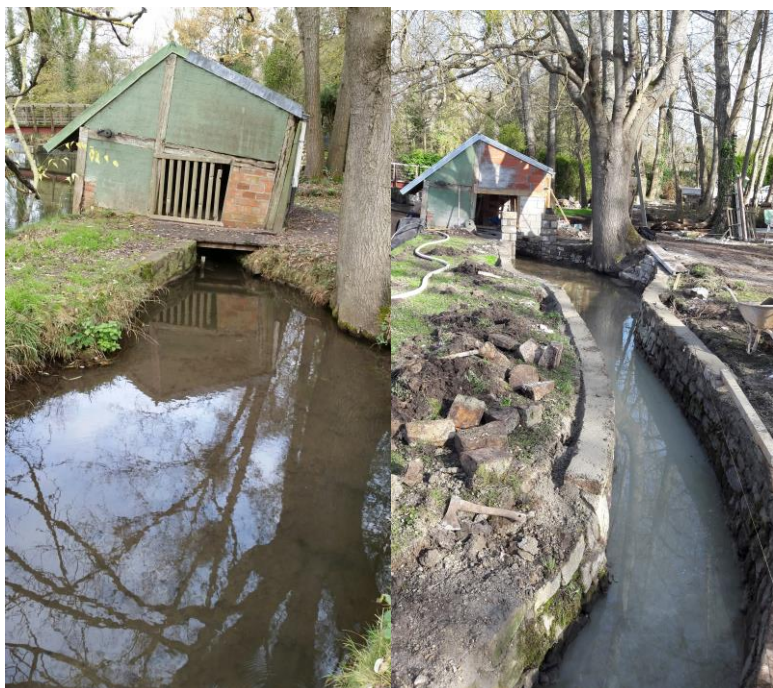
Lavoir avant travaux