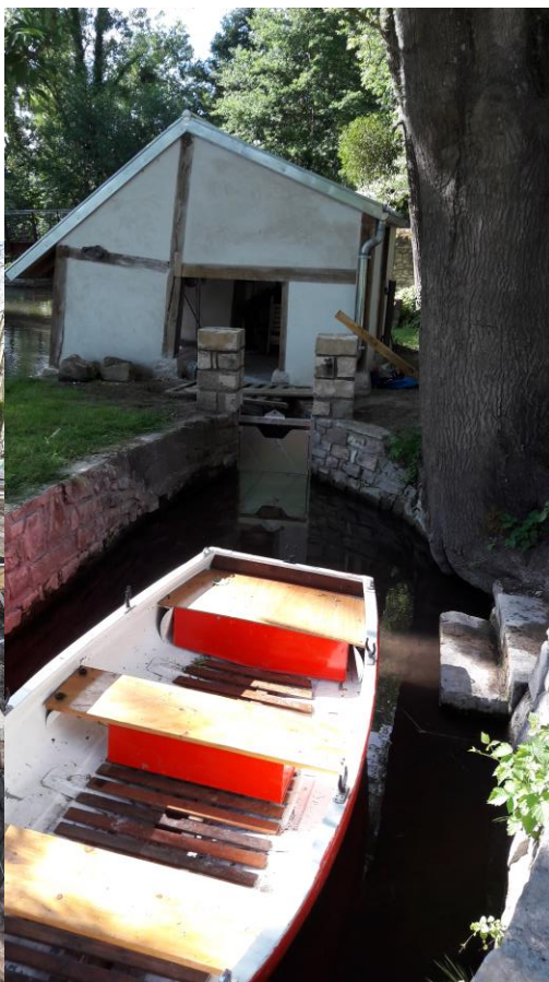
Fin des travaux