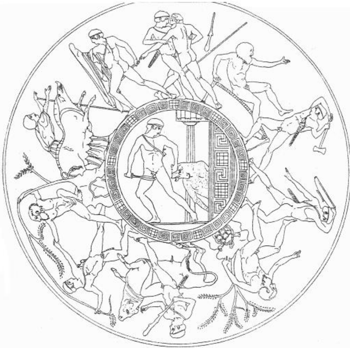
Les exploits de Thésée