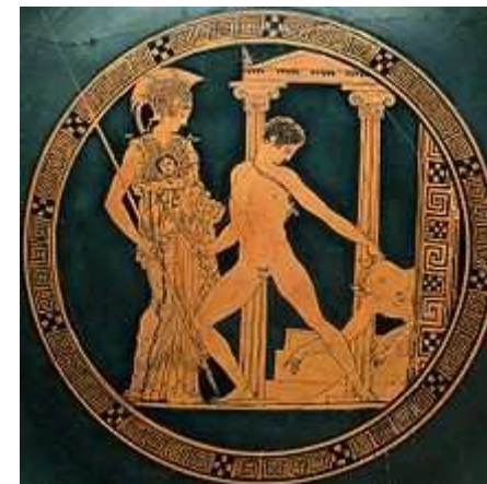
Thésée combattant le Minotaure

4) Avec qui Thésée se trouve-t-il nez à nez lorsqu'il s'échappe de sa chambre pour aller à la rencontre d'Héraclès ? _____