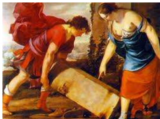
Thésée et sa mère, Aethra