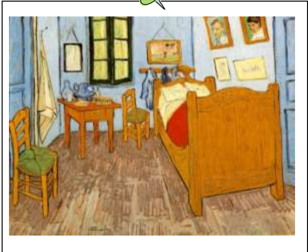
La chambre de Van Gogh à Arles

Vincent Van Gogh naquit aux Pays-Bas en 1853. Il ne commença à peindre sérieusement qu'à l'âge de 27 ans. Auparavant, il avait exercé toutes sortes de métiers, souvent à l'étranger. Il travailla pour un marchand d'art, fut prédicateur, enseignant en Grande-Bretagne et évangéliste en Belgique.