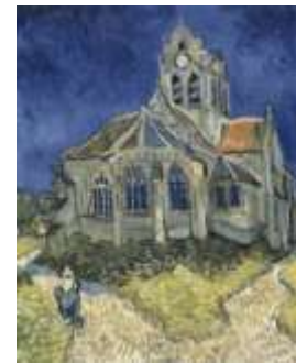
L'église d'Auvers sur Oise

La nuit, il collait des bougies sur son chapeau et au-dessus de son chevalet pour continuer à travailler. En 1890, à l'âge de 37 ans, Van Gogh se suicida. Sa carrière d'artiste n'avait duré que 10 ans, mais durant cette période, il avait peint 1 600 tableaux !