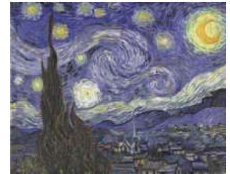
La nuit étoilée