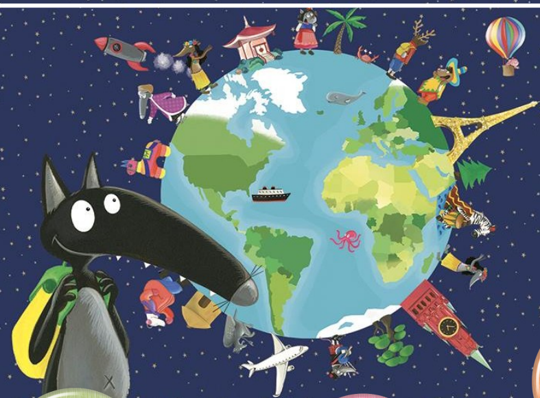
Illustration Éléonore Thuillier