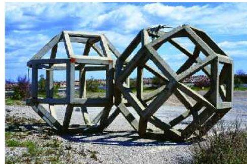
Raphaël Zarka, Sept ans après , 2008.

L'exposition à Sérignan va se développer autour de deux formes omniprésentes dans son travail, sur les deux niveaux du musée : le rhombicuboctaèdre et les prismatiques.