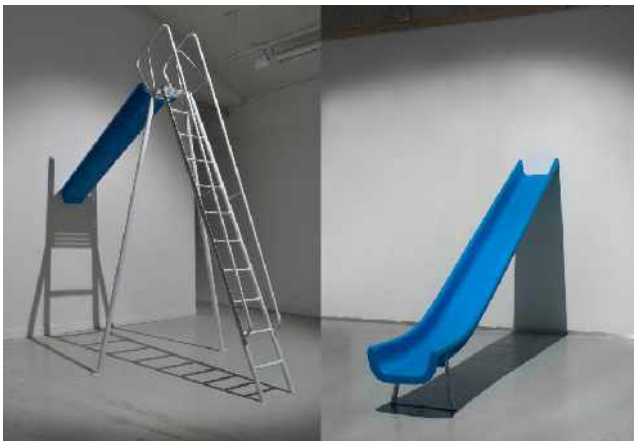
Maxime Boutin, S(L)IDE, 2013. Techniques mixtes, résine polyester, métal, peinture, 500 x 300 x 100 cm.

Né en 1988 à Colombes, France. Vit et travaille à Montpellier, France. Diplômé de l'École Supérieure des Beaux-Arts de Montpellier Agglomération en 2013.