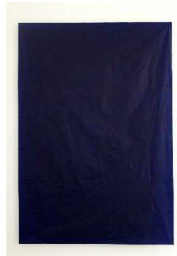
Nina Roussière, Sans titre , 2011. Papiers transfert, 120 x 90 cm.

Réalisé à même le mur à l'aide d'un cordeau traceur de maçon, Sinopia #1 résulte de la patiente répétition d'un geste. Le pigment ocre rouge ici choisi rappelle la couleur utilisée jusqu'au milieu du XVI e siècle pour réaliser les dessins préparatoires des fresques.