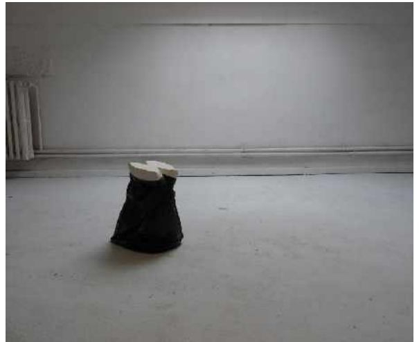
Jérémy Lopez, Négatif / Positif , 2012. Sac plastique noir et plâtre surélevé, 30 x 15 x 60 cm.

Ligne de conduite , issue de la série dite "À mains levées" – plusieurs pièces basées sur le souci de suivre servilement ce qui est déjà là, inscrit, tracé – utilise le papier avec l'intention de l'imitation. Du tracé de lignes au quasi monochrome, Ligne de conduite s'affranchit de la structure formelle au profit du dessin "vibrant". Ne plus penser, laisser faire les mains ou Comment "utiliser" l'ennui .