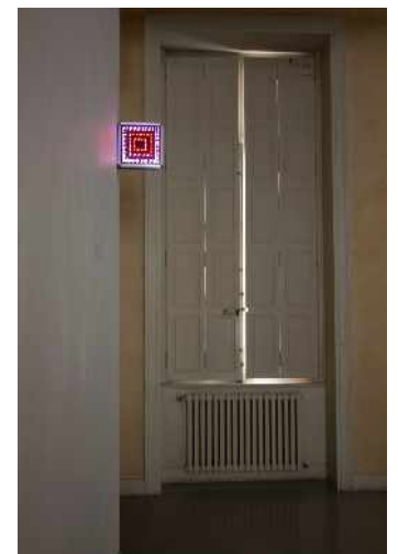
Laura Samé, Go Back Home , 2013. Enseigne lumineuse chinoise, 30 x 30 cm.

Avec Go Back Home , en donnant au signe "Hui" qui signifie "retourne à la maison" pour les Chinois, la forme d'une enseigne lumineuse, Laura Samé détourne tout simplement la fonction commerciale, séduisante, attractive de l'enseigne. À l'invitation "viens", elle substitue l'injonction "va-t'en". Mais ce visuel est également une référence à la couverture du livre Corps utopique, les Hétérotopies de Michel Foucault, au signe aborigène figurant le cercle dans le cercle qui désigne le "lieu", le "home", le "hui" d'aujourd'hui dans lequel l'homme vit.