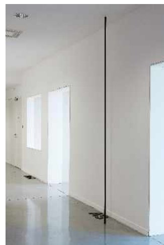
Peter Downsborough, "AND, AS, BUT" , 2013.

Ses nombreuses pratiques artistiques sont fondées sur la notion de position, de séquence, d'intervalle et de cadrage et interrogent le point de vue.