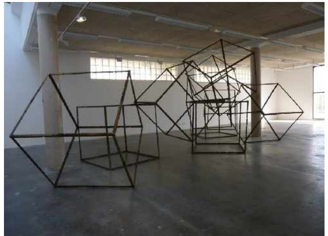
Camille Guibert, Cubes , 2013. Sculpture en métal, 150 x 150 x 150 cm (x10).

Les sculptures de Camille Guibert sont des propositions qui prennent appui sur différents axes. La répétition de la forme permet de tenir l'espace sans chercher pour autant à le structurer selon une organisation prédéfinie. Les structures sont démontables donc adaptables selon le lieu. Une fois leur position déterminée, celle-ci crée un effet d'optique qui rend chaque forme unique. L'équilibre des masses est récurrent, mais il autorise une certaine légèreté à un matériau brut, réputé plutôt lourd. Le travail de la ligne est également un axe évident du travail de Camille Guibert. Traité de façon tridimensionnelle, il laisse le spectateur se perdre dans la réalité de la perspective initiale. "Je fais très attention au rapport à l'espace lorsqu'il s'agit d'installer une pièce", explique Camille Guibert. "Un encombrement apparaît, souvent lié à des matériaux de construction, pour créer un équilibre. Le poids des matériaux utilisés est contrebalancé par la légèreté des formes. Ces formes – par exemple le cube – entretiennent pour moi des relations fortes avec l'histoire de l'art. Je travaille sur des principes d'assemblage et sur la limite de la stabilité".