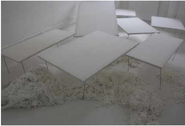
Rosita Taurone, Insectes, Cécité-Aveuglement , 2013. Bois, coton, nylon, paraffine, métal, dimensions variables.

Née en 1987 à Roccadasepide, Italie. Vit et travaille à Lyon, France. Diplômée de l'École Supérieure des Beaux-Arts de Nîmes en 2013.