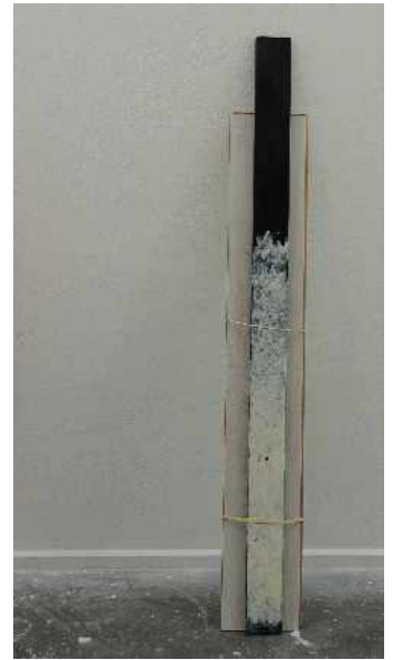
Adrien Blondel, Parquet 2, 2013. Lattes superposées, dimensions variables.