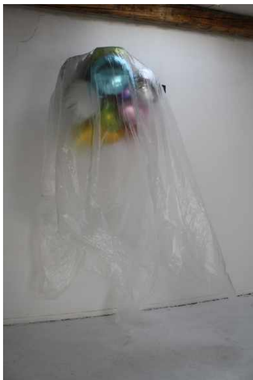
Xiaoye Wu, Méduse , 2013. Ballons, hélium, bâche plastique, 230 x 100 x 140 cm.

Née en 1980 à Quyang, Chine. Vit et travaille à Nîmes, France. Diplômée de l'École Supérieure des Beaux-Arts de Nîmes en 2013.