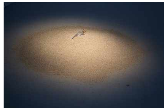
Miao Wei, La bouteille à la mer , 2012. Billet de 10 euros, bouteille, sable, 200 cm de diam.

S'agissant de La bouteille à la mer , après avoir mis dix euros dans la bouteille, Miao Wei a jeté ladite bouteille. Quand on a retrouvé cette bouteille, la valeur de la monnaie embouteillée avait changé. Dans le couloir du temps, l'artefact symbolique avait perdu ses valeurs d'usage et d'échange économique. Il était devenu une espèce de pièce archéologique.