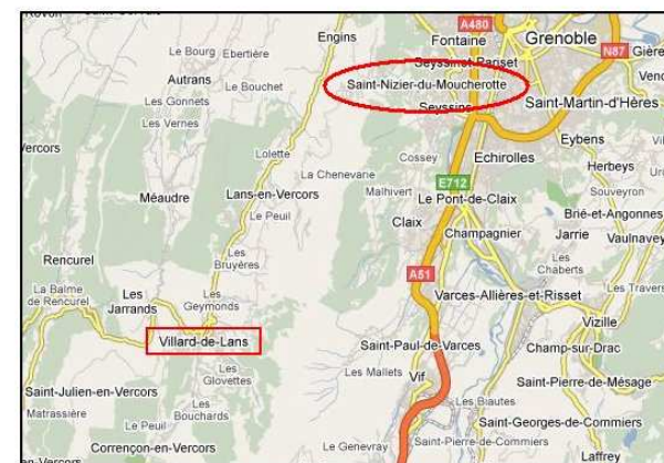
Situation de Saint-Nizier-du-Moucherotte

Un autre renseignement ? Consultez le site du Petit Randonneur :