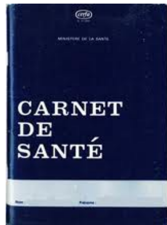
carnet de santé