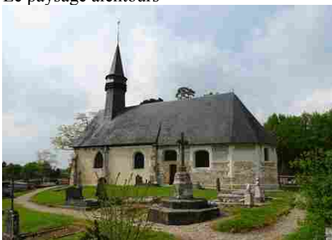
L'église de Barville en Lieuvin