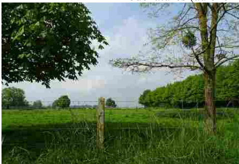
Le paysage alentours

Les avis seront cohérents avec ceux émis ces dernières années, à savoir : pas de maisons à volume compliqué (type V, W, Y, ou Z), Rez-de-chaussée + Combles, pentes à 45° pour les volumes principaux, ardoise ou tuile plate de teinte brun vieilli, à 20u/m 2 , avec un débord de toiture de 20cm, enduit de teinte beige clair avec modénatures (au choix : chaînages, encadrement de fenêtres, soubassement, colombage...). *Voir autres fiches.