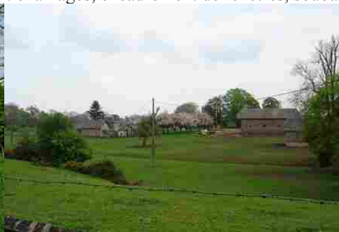
Une ferme et son verger