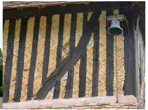
Les matériaux en façade (détail)