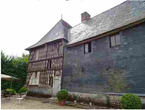
La façade arrière (habillage d'ardoises)