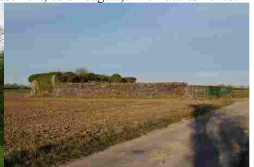
Un vestige de l'aérodrome allemand