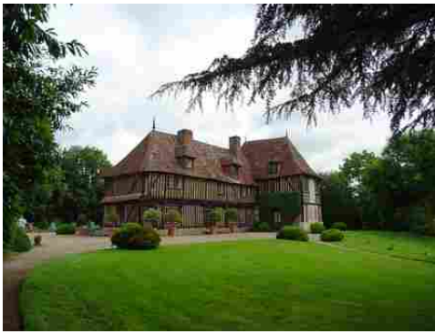
Le manoir (vue éloignée)