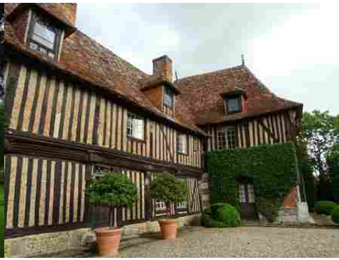
Le manoir (vue rapprochée)