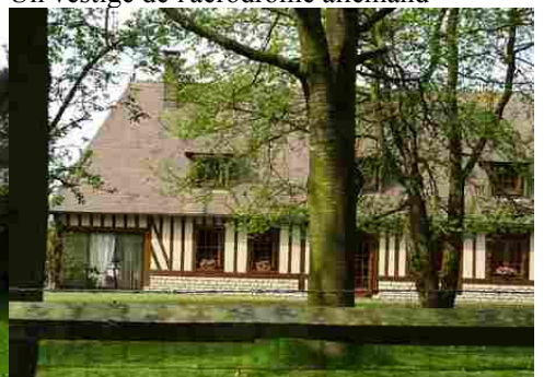
Un exemple d'architecture rurale