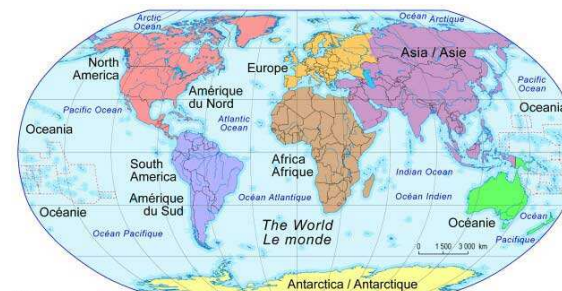
© 2001. Her Majesty the Queen in Right of Canada, Natural Resources Canada. / Sa Majesté la Reine du chef du Canada, Ressources naturelles Canada.