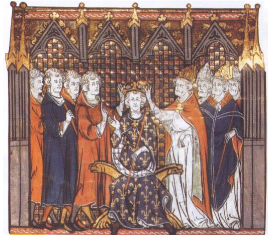
DOC. 9 Le couronnement d'Hugues Capet (miniature du 14 e siècle).

Cette élection, dit Augustin Thierry dans ses « Lettres sur l'histoire de France », n'eut point lieu avec des formes régulières. On ne s'avisa ni de recueillir, ni de compter les voix des seigneurs, ce fut un coup d'entraînement, et Hugues Capet devint roi des Français parce que sa popularité était immense.