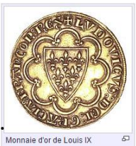
Monnaie d'or de Louis IX