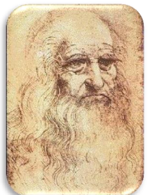
Léonard de Vinci