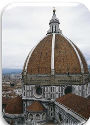
Vue du la coupole de la cathédrale de Florence, Filippo Brunelleschi, Italie, Florence, Fratelli Alinari © Archives Alinari, Florence, Dist RMN / Georges Tatge